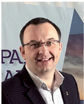
Автор: Роман Кравцов, член Квалификационной комиссии АП Иркутской области