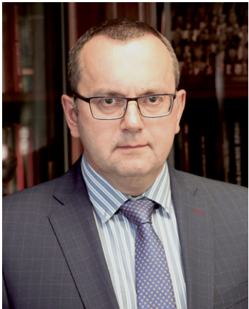
Автор: Олег Смирнов, президент АП Иркутской области