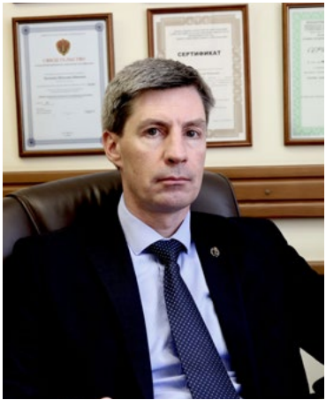
Автор: адвокат Рогозный Вячеслав Юрьевич, член Квалификационной комиссии АП Иркутской области