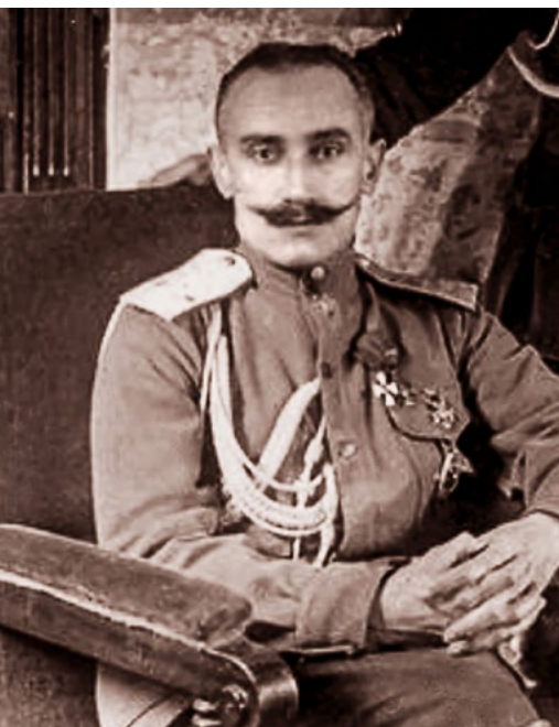
БОГОСЛОВСКИЙ БОРИС ПЕТРОВИЧ (1885—1920),

Газета «Мысль» была закрыта военными властями 15 марта того же, 1919, года – на пятой неделе своего существования.