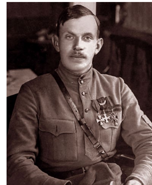
ГАЙДА (ГЕЙДЛЬ) РАДОЛА (РУДОЛЬФ) (14.02.1892-15.04.1948),

— С первого февраля (то есть, считайте, полтора месяца) ни копейки не получили, – старательно сдерживаясь, рассказывал пожилой рабочий. Хотели на