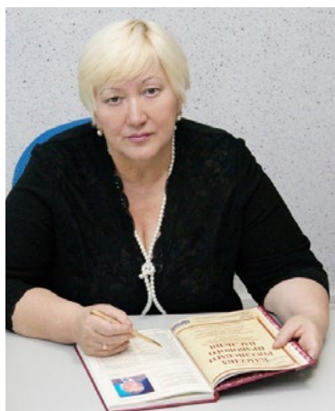
Автор: адвокат Каверзина Валентина Леонидовна, Руководитель Школы молодого адвоката, Председатель коллегии адвокатов «Лига сибирских адвокатов»